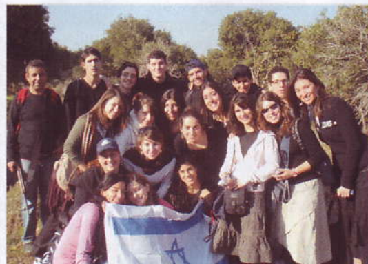
Marche écologique au Golan

Nous vous ferons vivre dans les semaines à venir, quelques unes de nos étapes et nos souvenirs durant ce voyage.