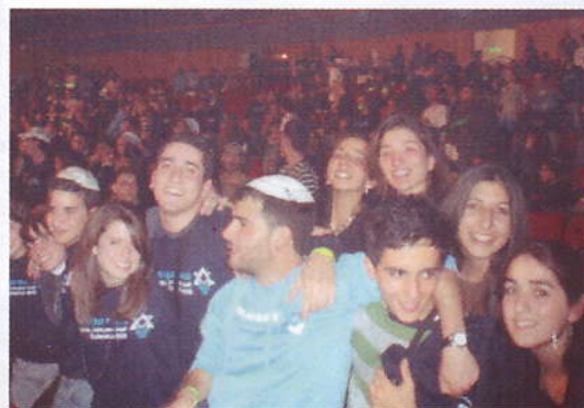
Forum des études en Israël - Concert présidé par Shimon Perez