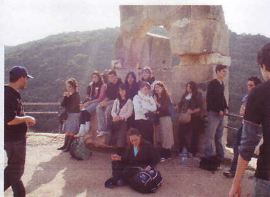
Visite de nos jeunes à Katsrin, capitale du Golan