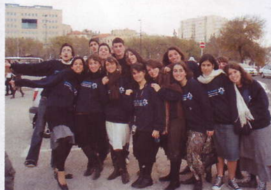
Pause photo à Jérusalem